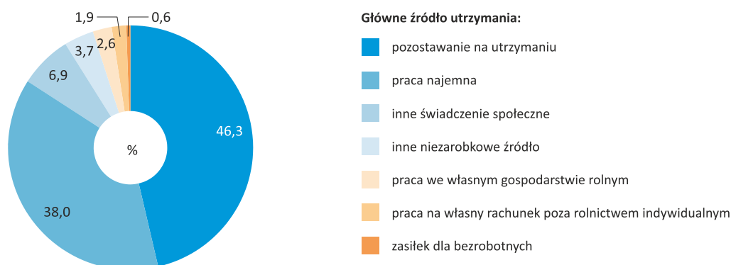
Wyk. 2. Struktura ludności w wieku 15-29 lat według głównego źródła utrzymania w IV kwartale 2016 r.

Ponadto w województwie kujawsko-pomorskim w IV kwartale 2016 r.: