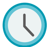
czas trwania podróży