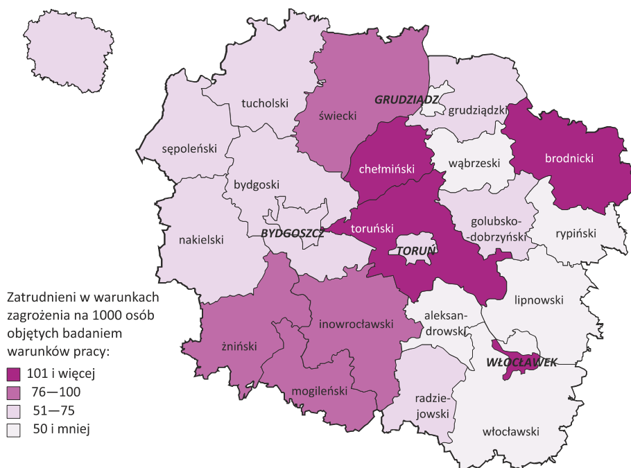
ZATRUDNIENI a W WARUNKACH ZAGROŻENIA W POWIATACH I MIASTACH NA PRAWACH POWIATU W 2016 R. Stan w dniu 31 XII

a Liczeni tylko jeden raz w grupie czynnika przeważającego.