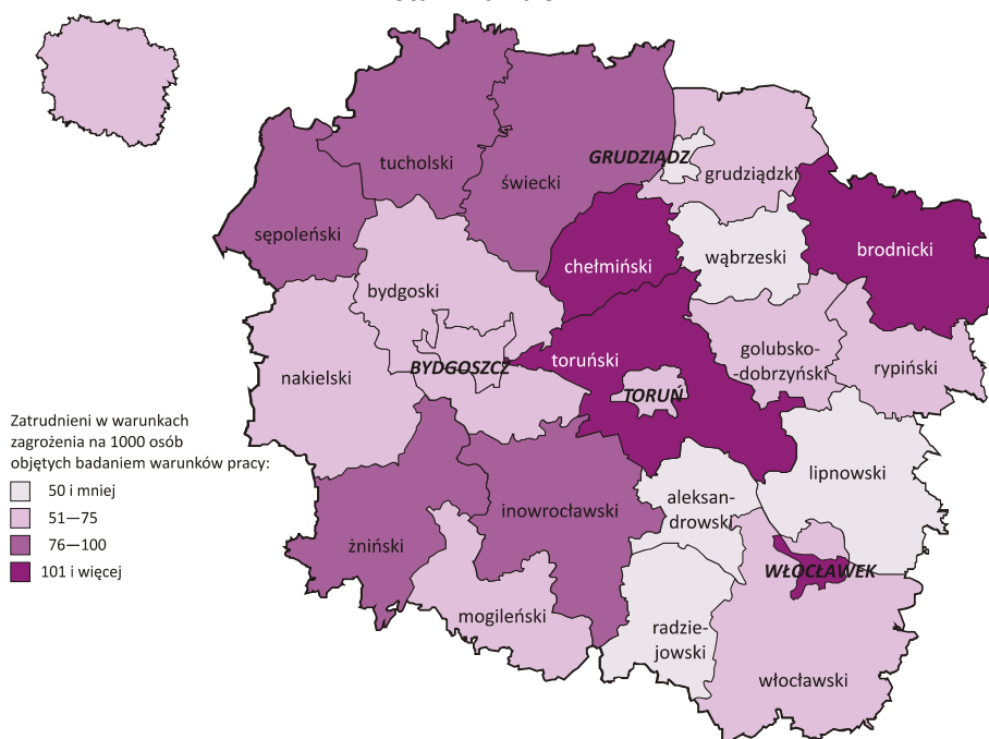
ZATRUDNIENI a W WARUNKACH ZAGROŻENIA WEDŁUG POWIATÓW W 2015 R. Stan w dniu 31 XII

Zatrudnieni w warunkach zagrożenia na 1000 osób objętych badaniem warunków pracy: