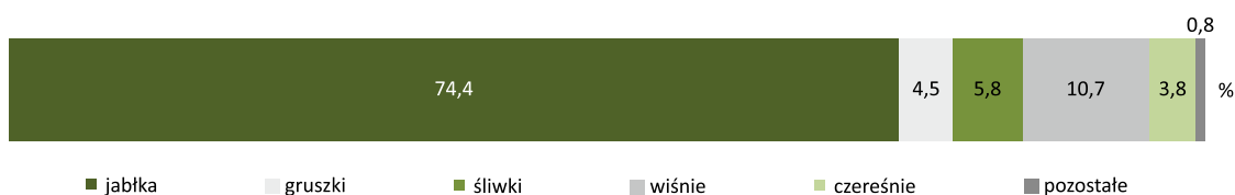
Wyk.3. Struktura zbiorów owoców z drzew w sadach w 2016 r.