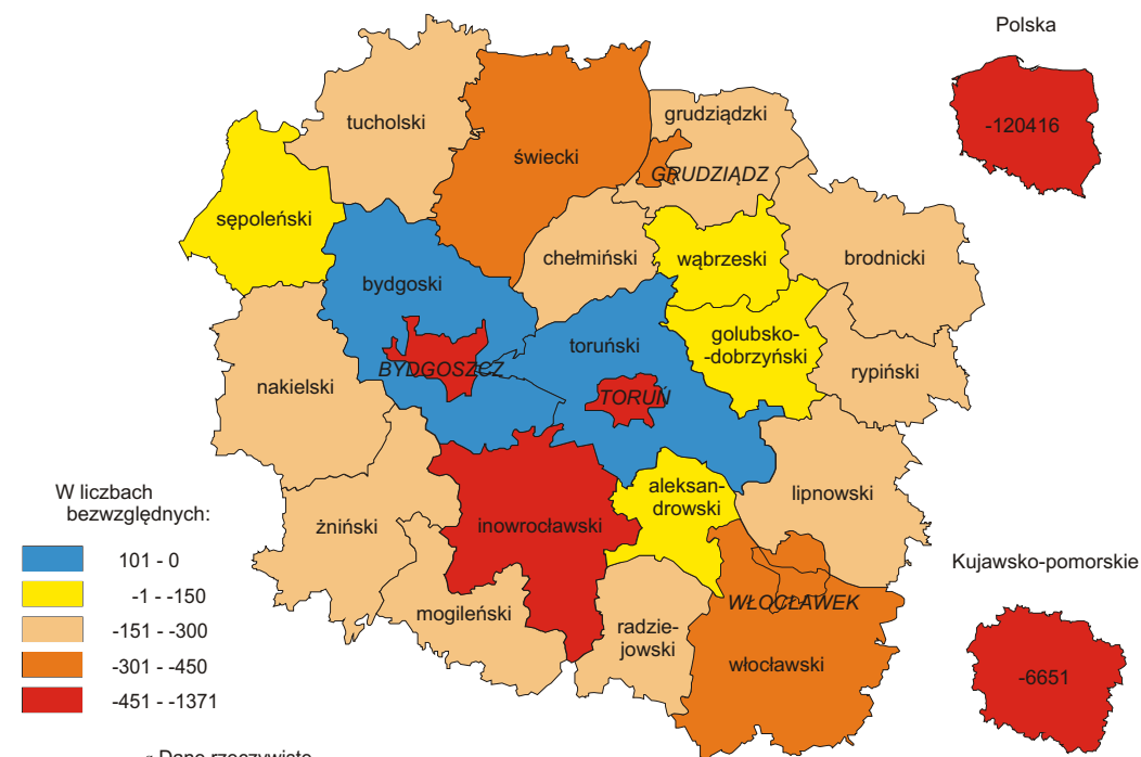
PROGNOZOWANA ZMIANA LICZBY URODZEŃ ŻYWYCH W LATACH 2014 a -2050