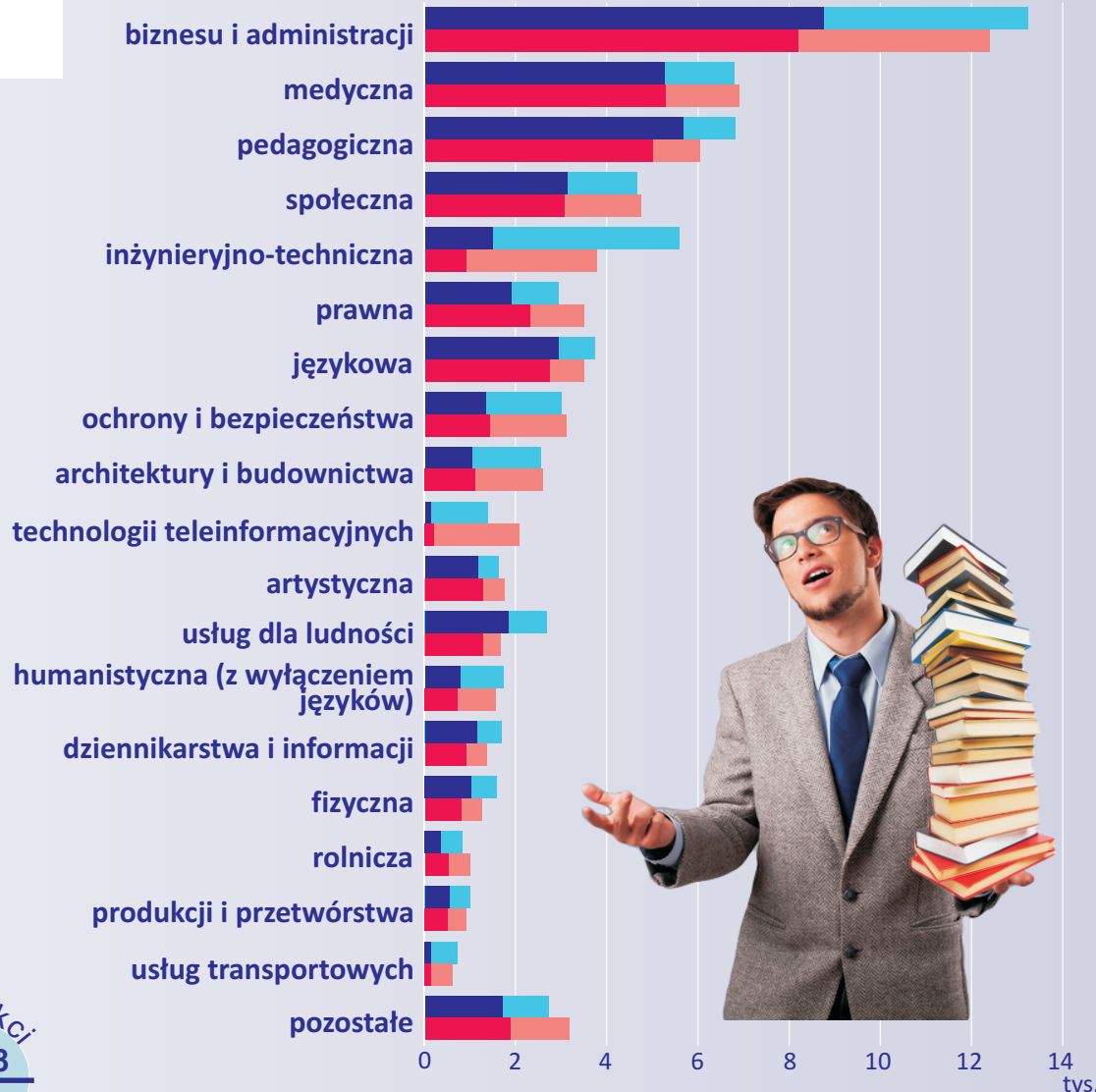
Studenci według podgrup kierunków studiów a