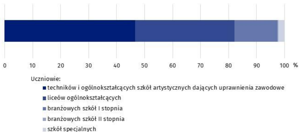
Wykres 2. Struktura uczniów szkół ponadpodstawowych według typów szkół w roku szkolnym 2021/2022