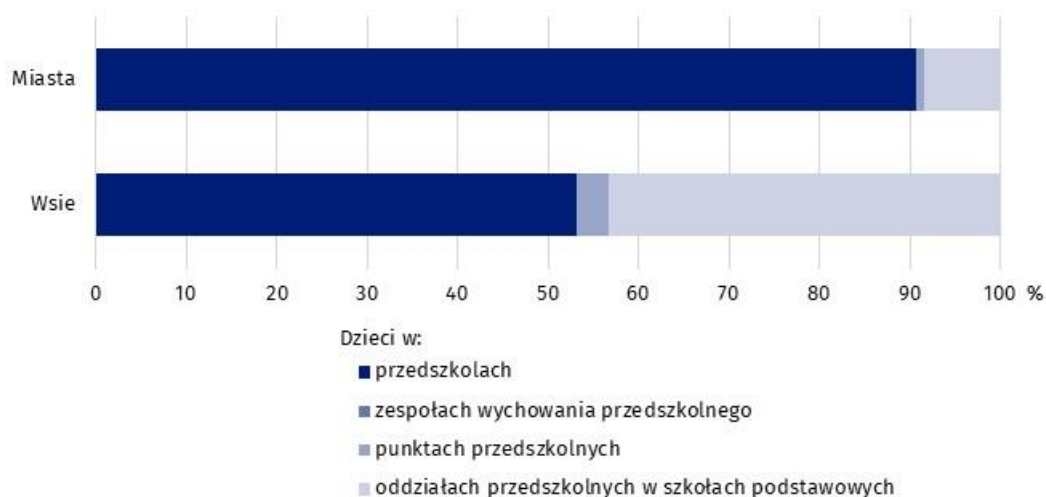
Wykres 1. Struktura dzieci w placówkach wychowania przedszkolnego w miastach i na wsiach w roku szkolnym 2021/2022