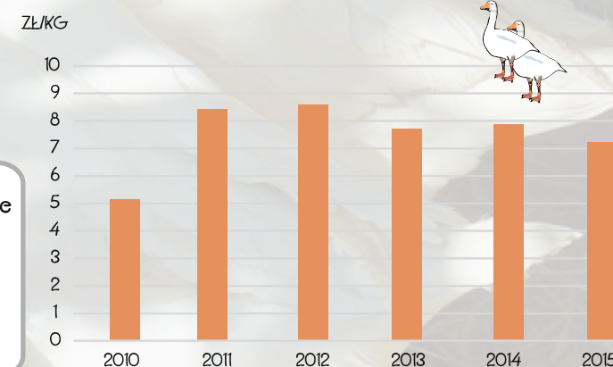
PRZECIĘTNE CENY SKUPU GEŚI (w wadze żywej)

W 2015 r. w województwie kujawsko-pomorskim przeciętnie 1 osoba spożyła 1,72 kg mięsa drobiowego w ciągu miesiąca. W stosunku do 2010 r. zanotowano spadek spożycia tego rodzaju mięsa o 1,7%.