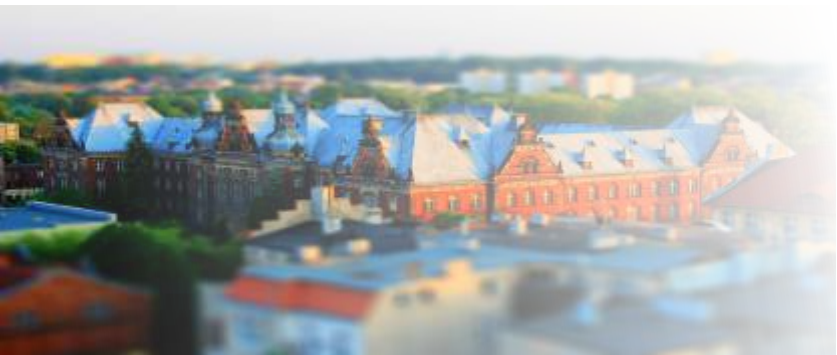
Bydgoszcz na tle innych miast wojewódzkich w 2016 r.