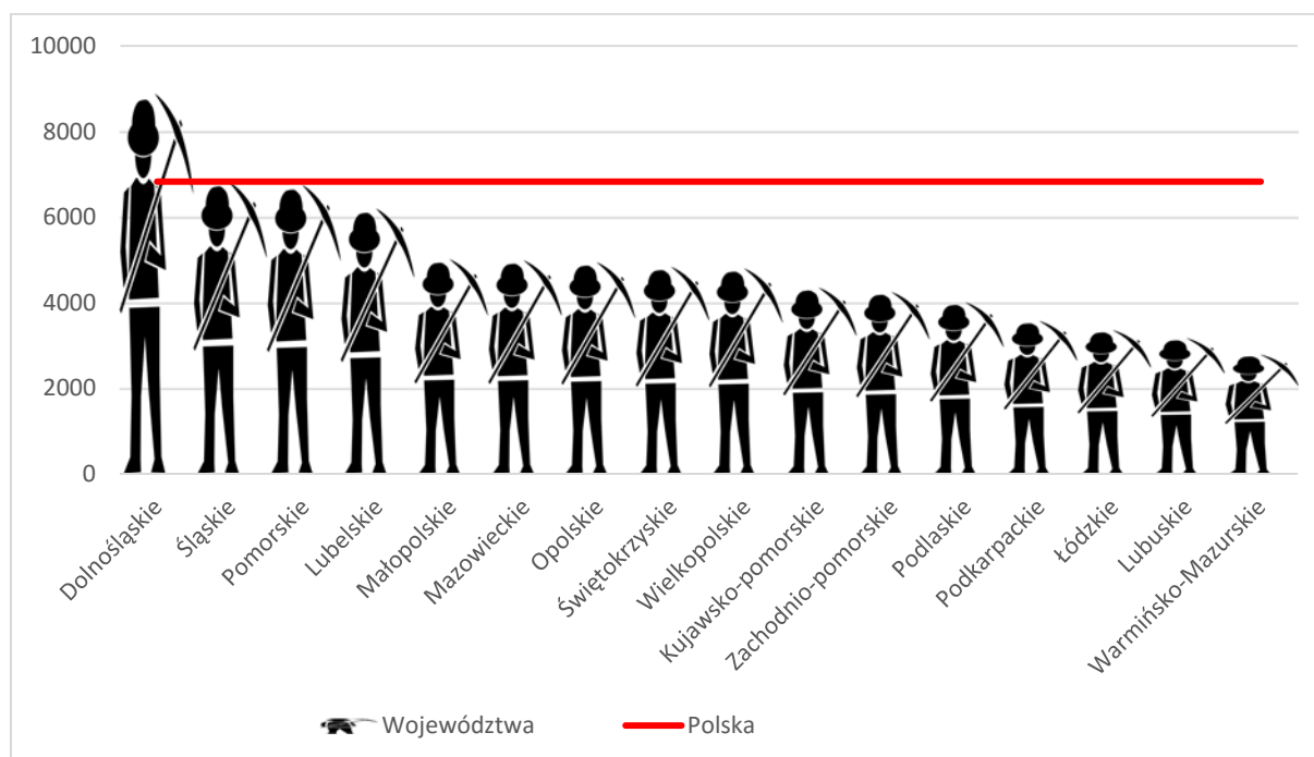
Ryc. 1. Przeciętne miesięczne wynagrodzenie brutto w sekcji górnictwo i wydobywanie w 2016 r.

Wynagrodzenia wypłacane w sektorze publicznym w większości elementarnych grup zawodów związanych z górnictwem i wydobywaniem były wyższe niż w sektorze prywatnym. Największa dysproporcja wystąpiła w grupie robotników wykonujących w kopalniach i kamieniołomach prace proste, w której pracownicy sektora publicznego otrzymywali wynagrodzenia o 35% wyższe od pracowników zatrudnionych w prywatnych przedsiębiorstwach. Odmienna sytuacja miała miejsce wśród pracowników dozoru ruchu oraz strażowych i zawodów im pokrewnych. W przypadku tych grup pracownicy sektora prywatnego otrzymywali wynagrodzenia wyższe o odpowiednio 8% i ponad 60% niż pracujący w podmiotach gospodarki narodowej należących do sektora publicznego.