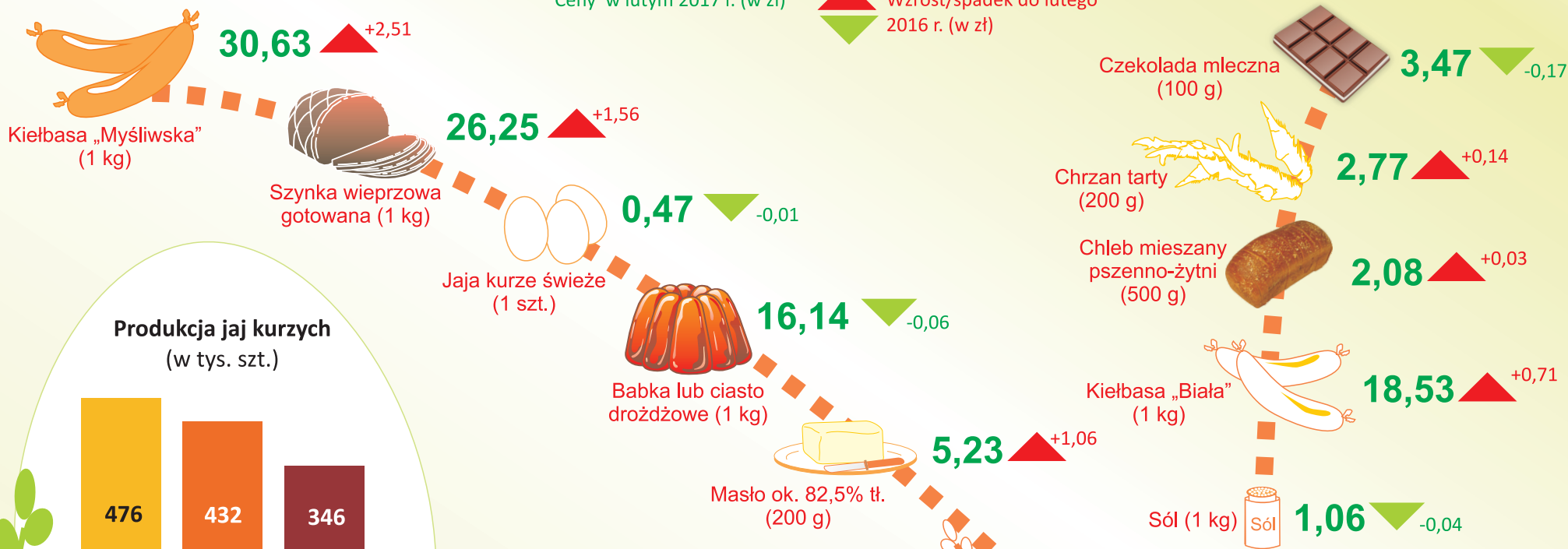
Produkcja jaj kurzych (w tys. szt.)